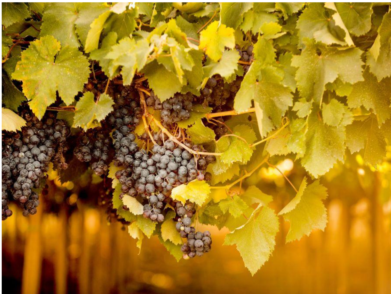
Grappoli in Abruzzo.

Un vino moderno, concentrato sul gusto del frutto, al naso e in bocca. Elegante il naso balsamico e fruttato, caldo e sapido il sorso, equilibratissimo nei tannini e nel lungo finale di erbe aromatiche. Info: agricolacirelli.com