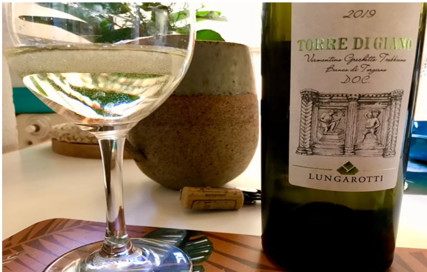
“Torre di Giano” Bianco di Torgiano Doc 2019 (Foto © Riccardo Isola).

Si parte da un color giallo paglierino vivo con riflessi verdognoli che al naso si traducono in immediati echi di fiori e frutti dalla polpa bianca con importanti presenze di pennellate d'agrumi. L'entrata al sorso è asciutta, strutturata e molto fresca. Note fruttate e floreali si riverberano in una mix da macedonia mediterranea con chiusura leggera e gentilmente amaricante. Un vino perfetto come aperitivo in estate ma che non disdice di accompagnarsi a primi piatti dal ragù bianco di cortile o da primi di pesce. Da provare anche con sushi (sia internazionale che del mare Nostrum)