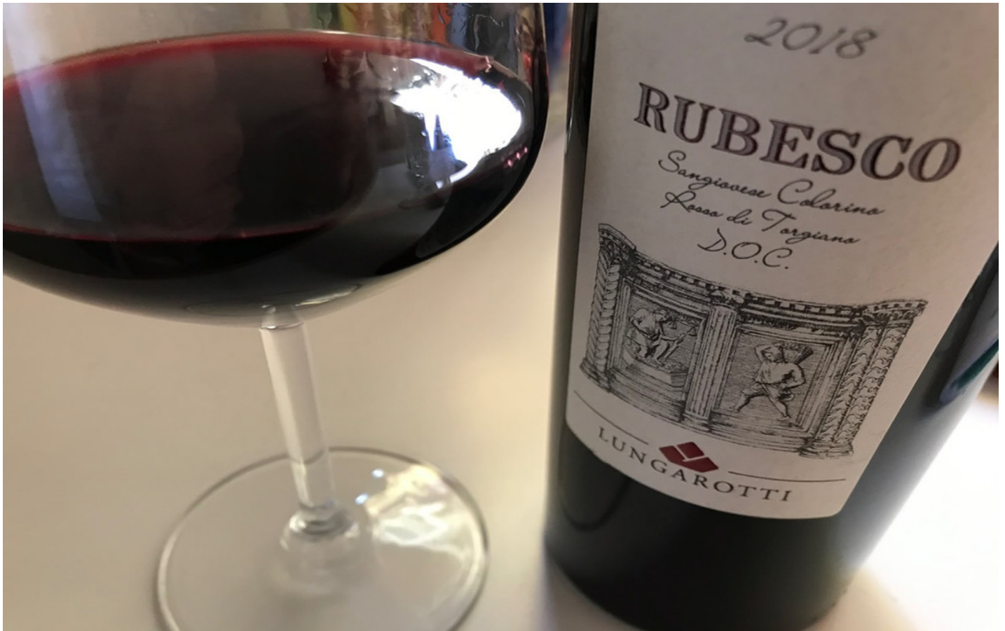
“Rubesco” Rosso di Torgiano Doc 2018.

Il Rubesco viene prodotto in circa 450mila bottiglie l'anno e nasce a seguito di una fermentazione in acciaio con macerazione per 15 giorni , affinamento di un anno in botte e uno in bottiglia.