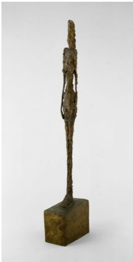
A. Giacometti – “Tall figure”