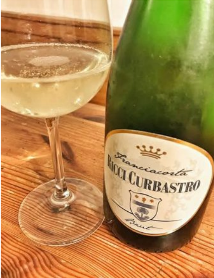
Franciacorta Brut Docg – Ricci Curbastro.