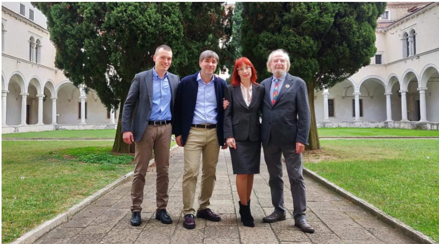
I curatori della Guida Oro I Vini di Veronelli (Foto © www.seminarioveronelli.com).