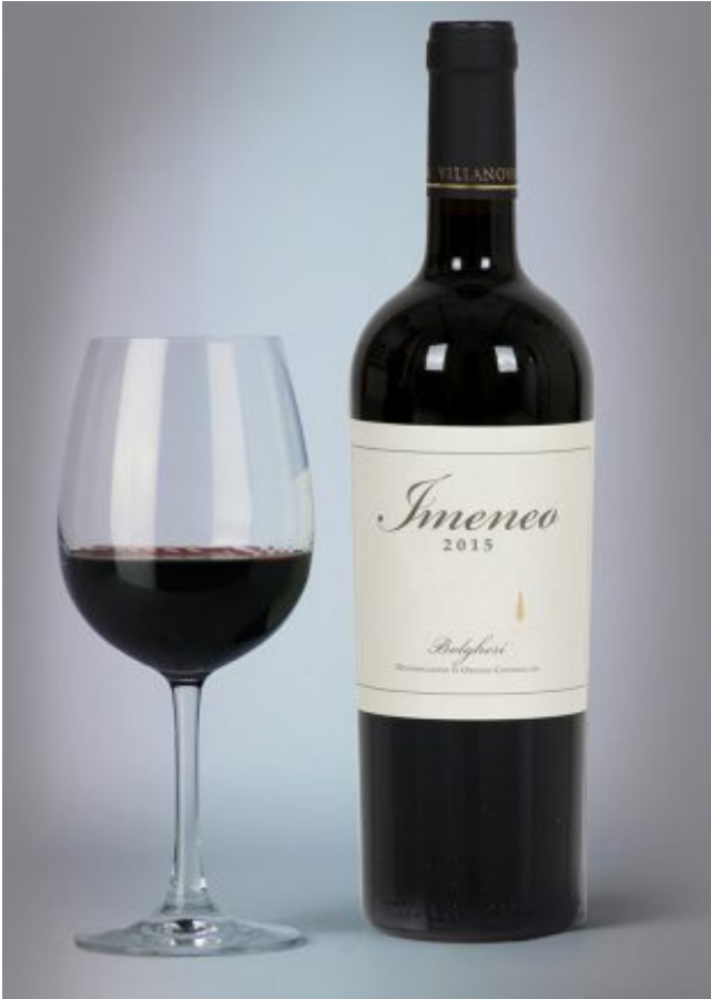
Villanoviana: Imeneo 2015 Bolgheri DOC.

Imeneo 2015 Bolgheri DOC dell' Azienda vinicola Villanoviana è frutto di un assemblaggio del 60% di Merlot e 40% di Cabernet Sauvignon che compiono 10 mesi di affinamento in barrique per poi sostare almeno 6 mesi in bottiglia.