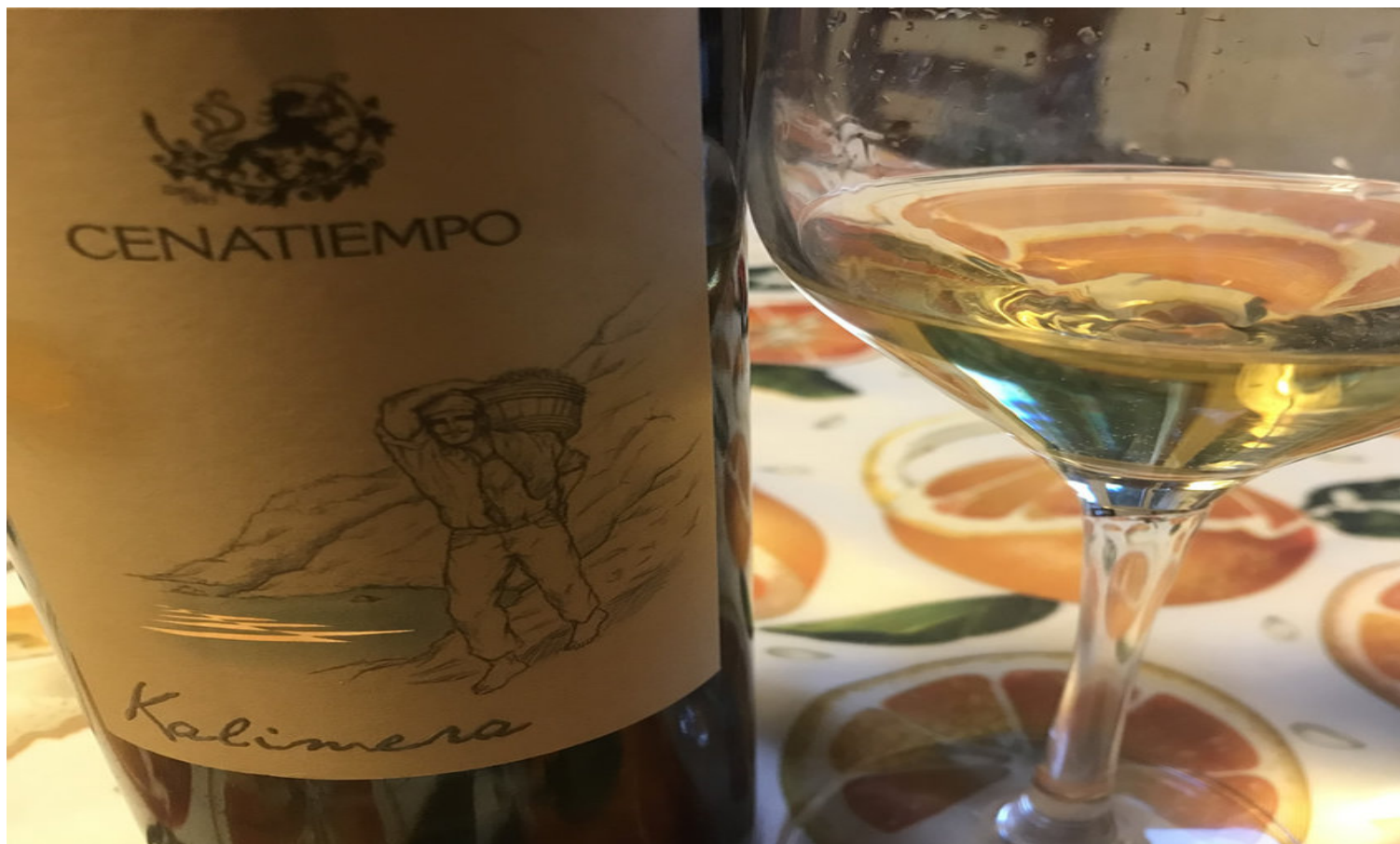
Kalimera di Cenatiempo.

Ci sono vini che sussurrano all'anima. Ci sono interpretazioni enoiche che sanno racchiudere, in un sorso, una storia, un territorio, un'emozione. Bene, tra questi c'è sicuramente il Kalimera della cantina Cenatiempo di Ischia , in località Serrara Fontana. Ben 450 metri sul livello del mare.