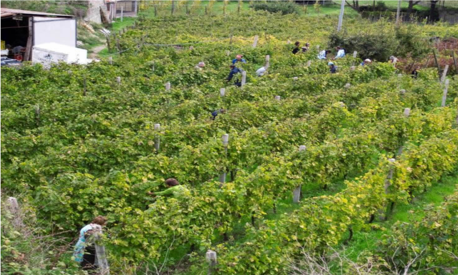
Alcuni vigneti dell'azienda Cenatiempo a Ischia.

Si fa fatica a parlare di emozione quando qualcuno questa emozione non l'ha provata. Si fa presto a dire e a dare punteggi altissimi. Ma questa volta si fa fatica veramente a non riconoscere un capolavoro liquido fatto vino.