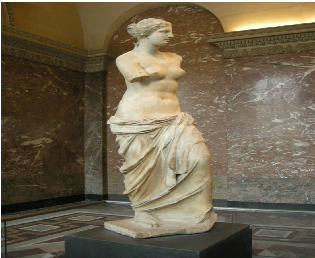
“Venere di Milo”, Alessandro di Antiochia (130 a.C.).