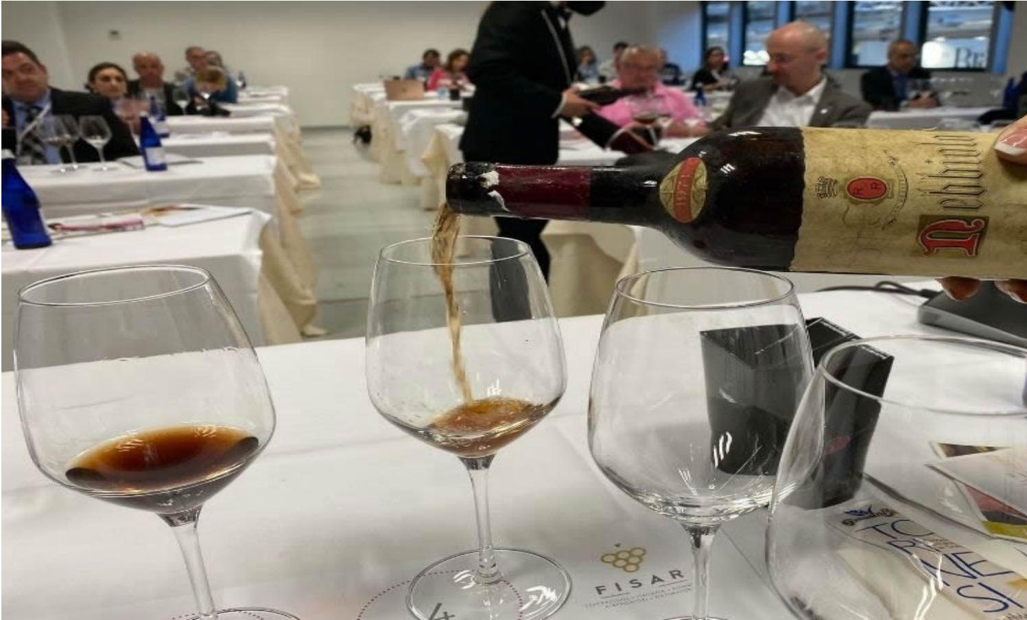
Nebbiolo d'Alba 1971, Az. agricola Renato Rabezzana.