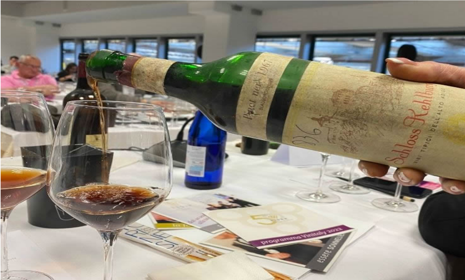
Bellemont Wagen, Pinot Nero 1967.