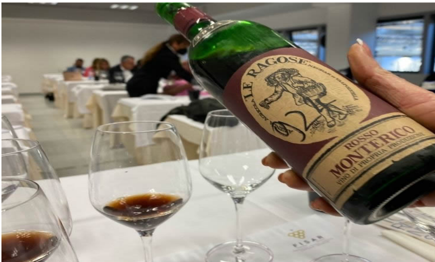
Rosso Montericco del 1971, Az. Le Ragose.