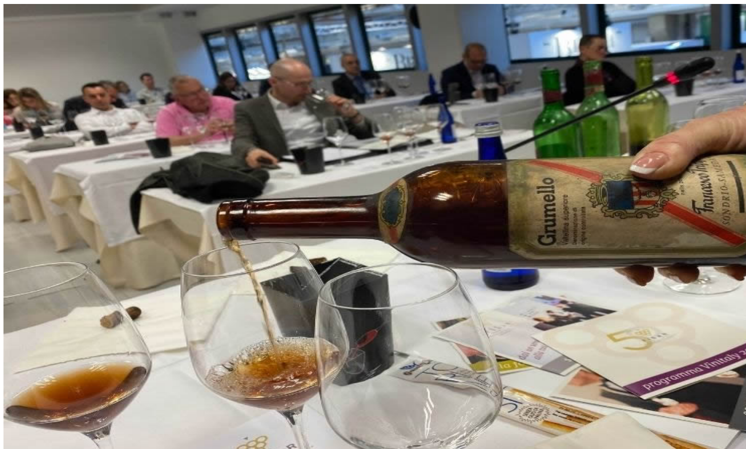
Grumello del 1969 dell'azienda Francesco Trippi (Foto © Raffaello De Crescenzo).