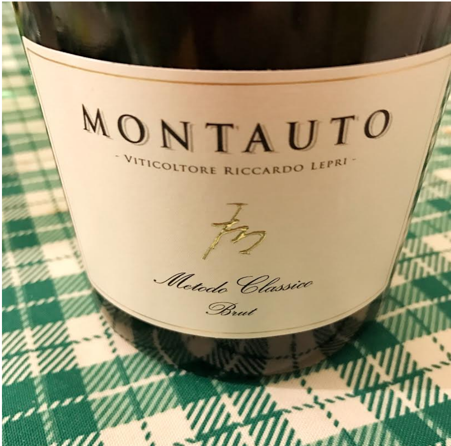
Montauto Brut Metodo Classico.

La Toscana del vino è una regione che fa del rosso il colore dominante. In Italia e nel mondo, si parla dei grandi vini rossi come Chianti Classico, Brunello di Montalcino e Nobile di Montepulciano, tanto per citarne alcuni. Ogni tanto, però, accade “l'imprevisto”, ossia che un vino toscano di altra tipologia possa essere ricordato per le sue innate qualità. E quando accade è sempre un evento più unico che raro.