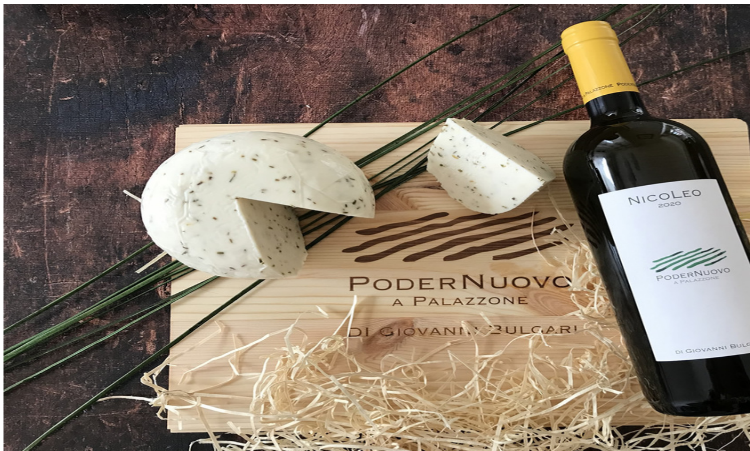
Nicoleo 2020 di Podernuovo a Palazzone, Grechetto e Chardonnay dai vigneti di Corbara