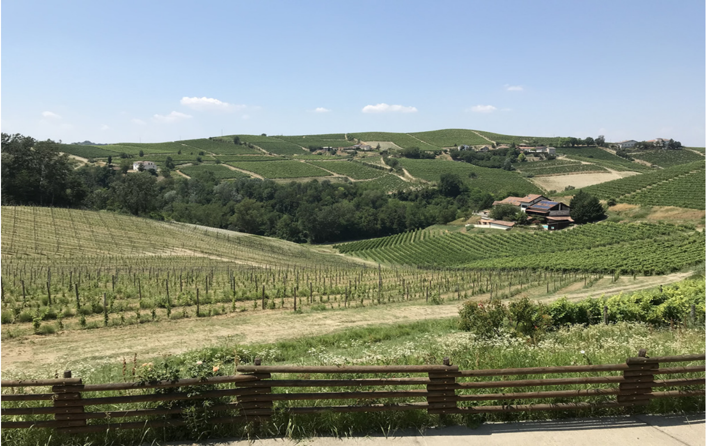
Colline del Monferrato.

È proprio il territorio compreso tra i 18 comuni previsti dal Disciplinare , che insieme alle tecniche di vinificazione, trasmette caratteristiche uniche alla al Nizza Docg.