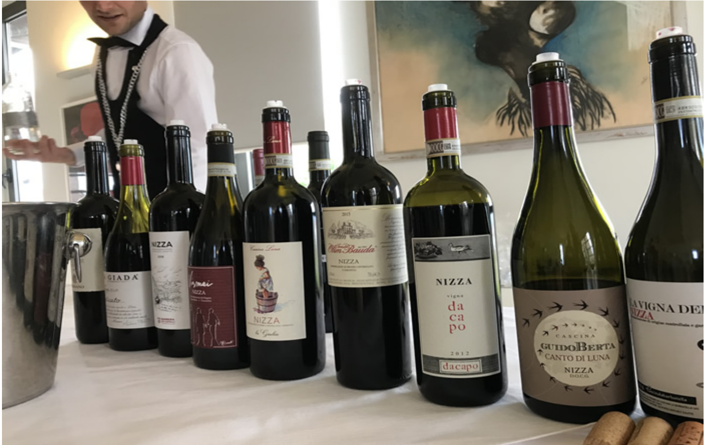
Alcune etichette del Nizza Docg.

Lo scorso 1 luglio a Nizza Monferrato , in provincia di Asti, si è festeggiato il quinto compleanno della Docg Nizza , una Denominazione riconosciuta giuridicamente nel 2014 ma che vanta una lunga storia legata al territorio e alla Barbera , uno dei vitigni di elezione del Piemonte ed in particolare dell'areale che comprende Nizza e l'Astigiano.