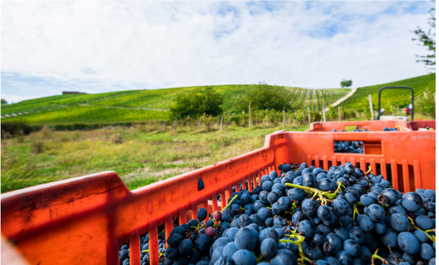
Uve Barbera per il Nizza Docg (Foto © Associazione Produttori del Nizza).