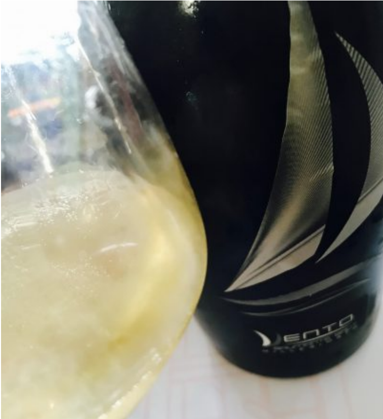
Vento spumante Cantine Teanum (Ph © Riccardo Isola).

Anche il meridione crea grandi spumanti. Al di là di una firma storica e autorevole come d'Araprì un altro importante interprete di questa tecnica di vinificazione molto più "nordica" come tradizione sono le Cantine Teanum .