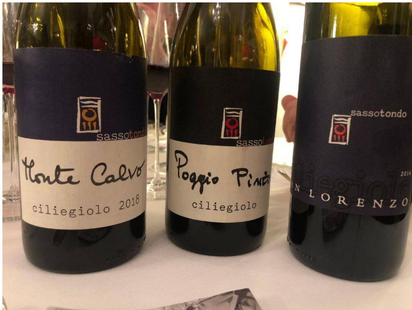
I tre cru di Ciliegiole in purezza della Cantina Sassotondo.