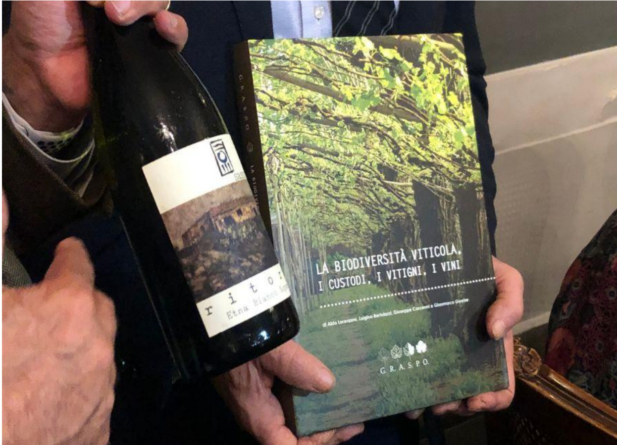
L'associazione G.R.A.S.P.O. al fianco del progetto "Ritorno".