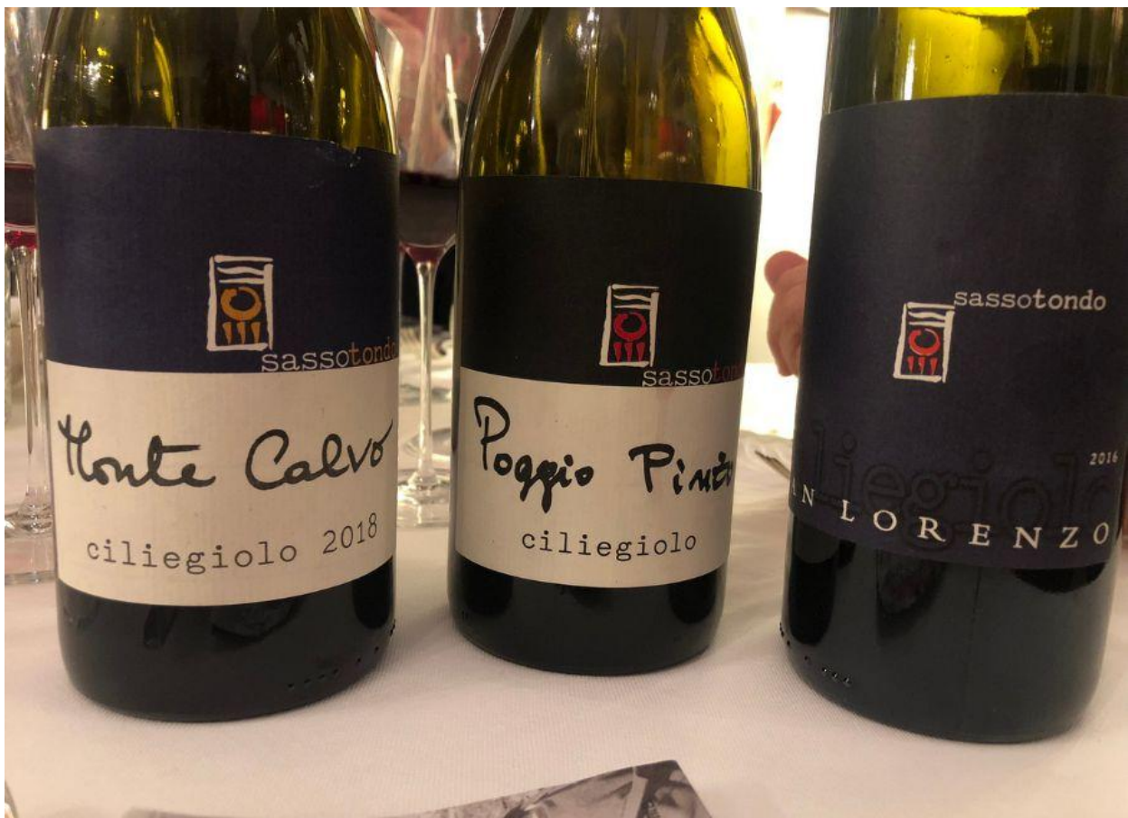
I tre cru di Ciliegiolo in purezza della Cantina Sassotondo.

Carla e Edoardo contano ora su 72 ettari, di cui circa 13 ettari e mezzo coltivati a vite, rigorosamente certificati bio sin dal 1994.