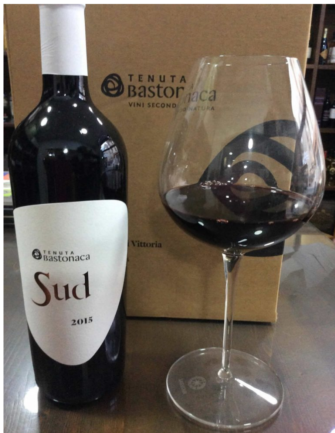
Sud 2015 Tenuta Bastonaca.