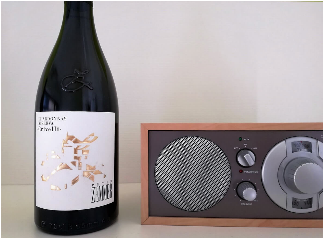
Tenuta Peter Zemmer – Chardonnay Riserva 2014.

Siamo in terra di confine. Siamo a Cortizza sulla Strada del Vino , una località in provincia di Bolzano che conta appena 600 abitanti. Di fatto uno dei più piccoli comuni esistenti, non solo in Alto Adige. Pochi abitanti ma tanta voglia di emergere e far sentire la propria presenza. Almeno in ambito vitivinicolo.