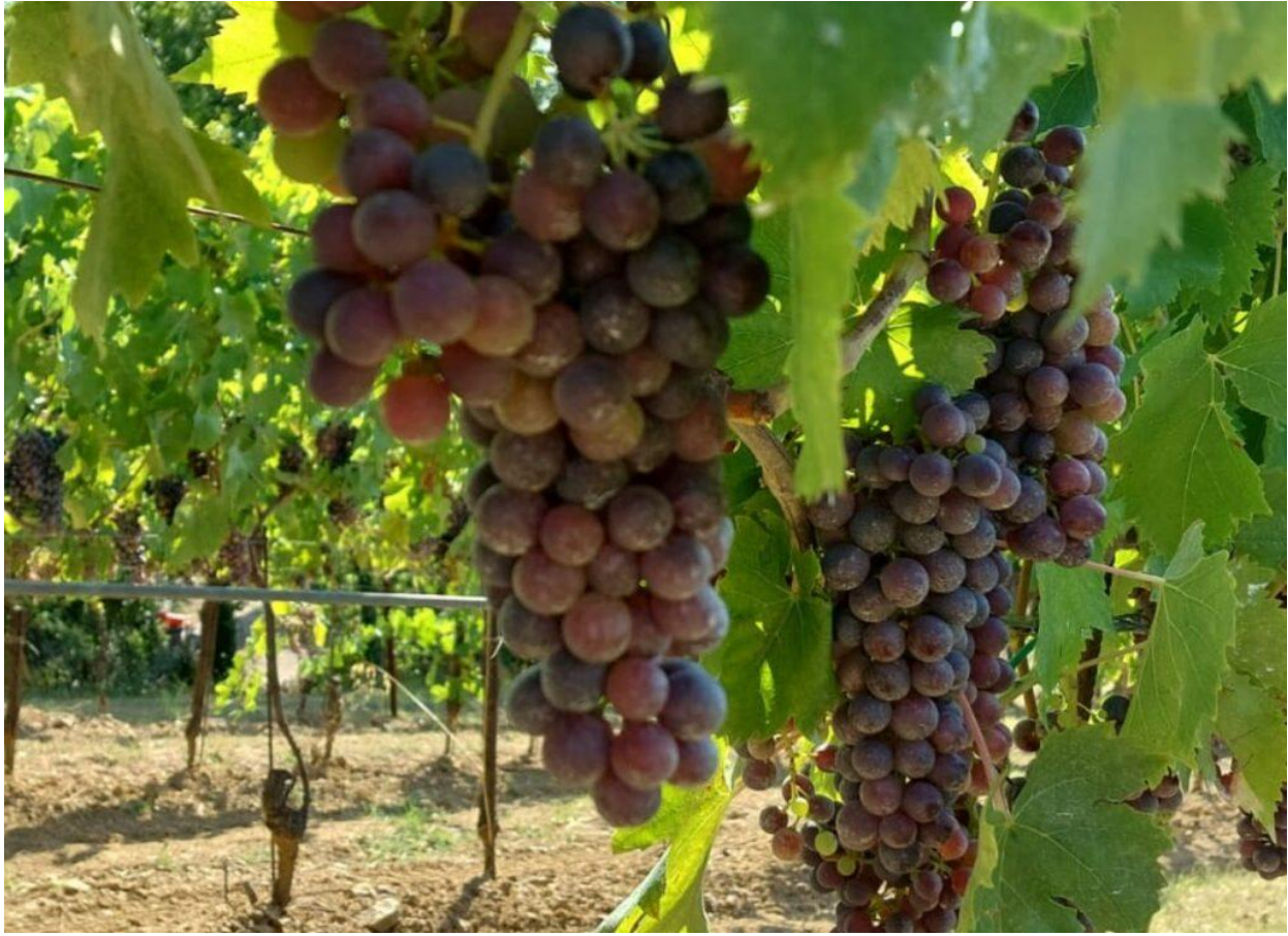
Filari di Sangiovese.