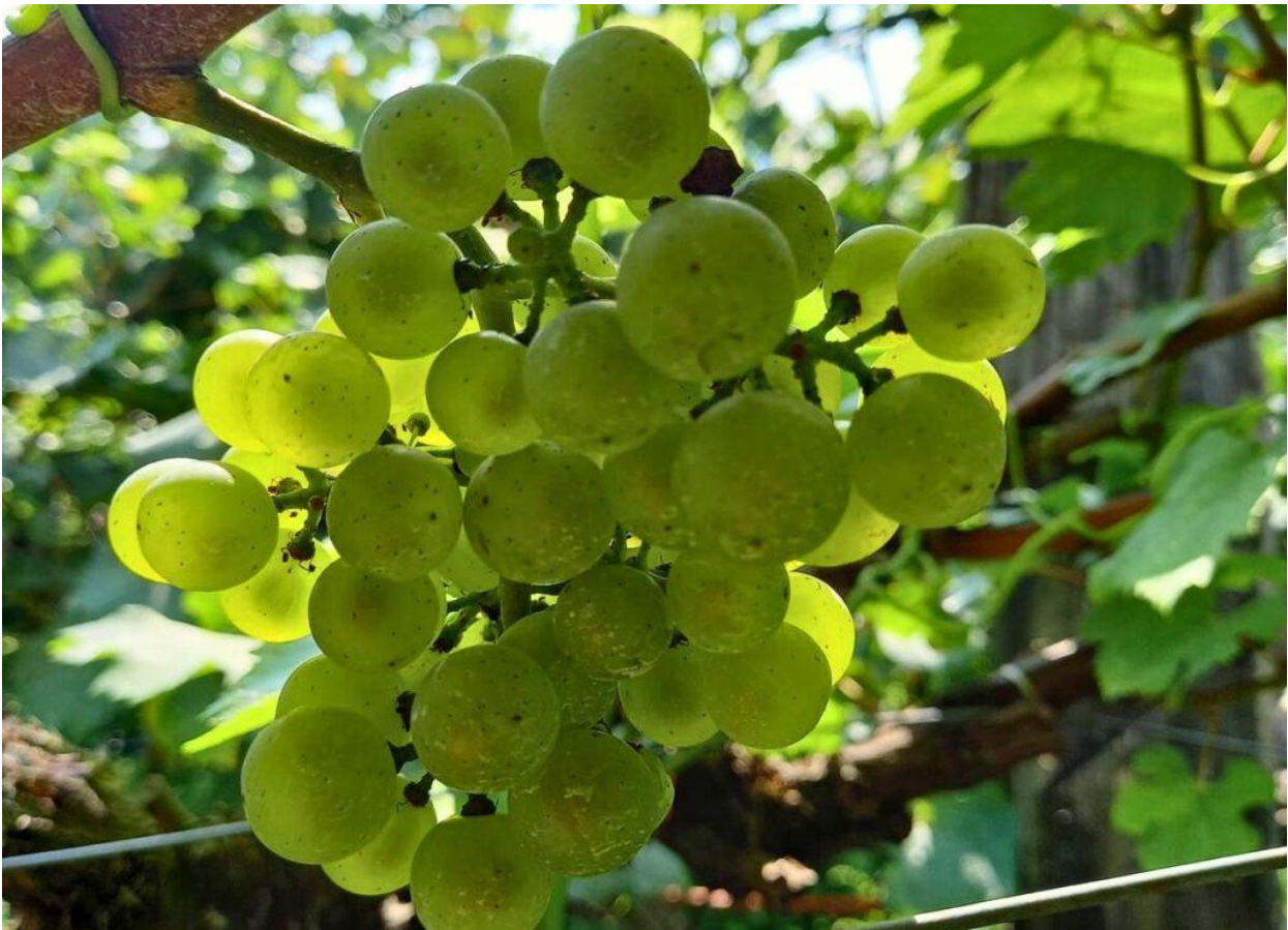
Grappoli di Pinot bianco.