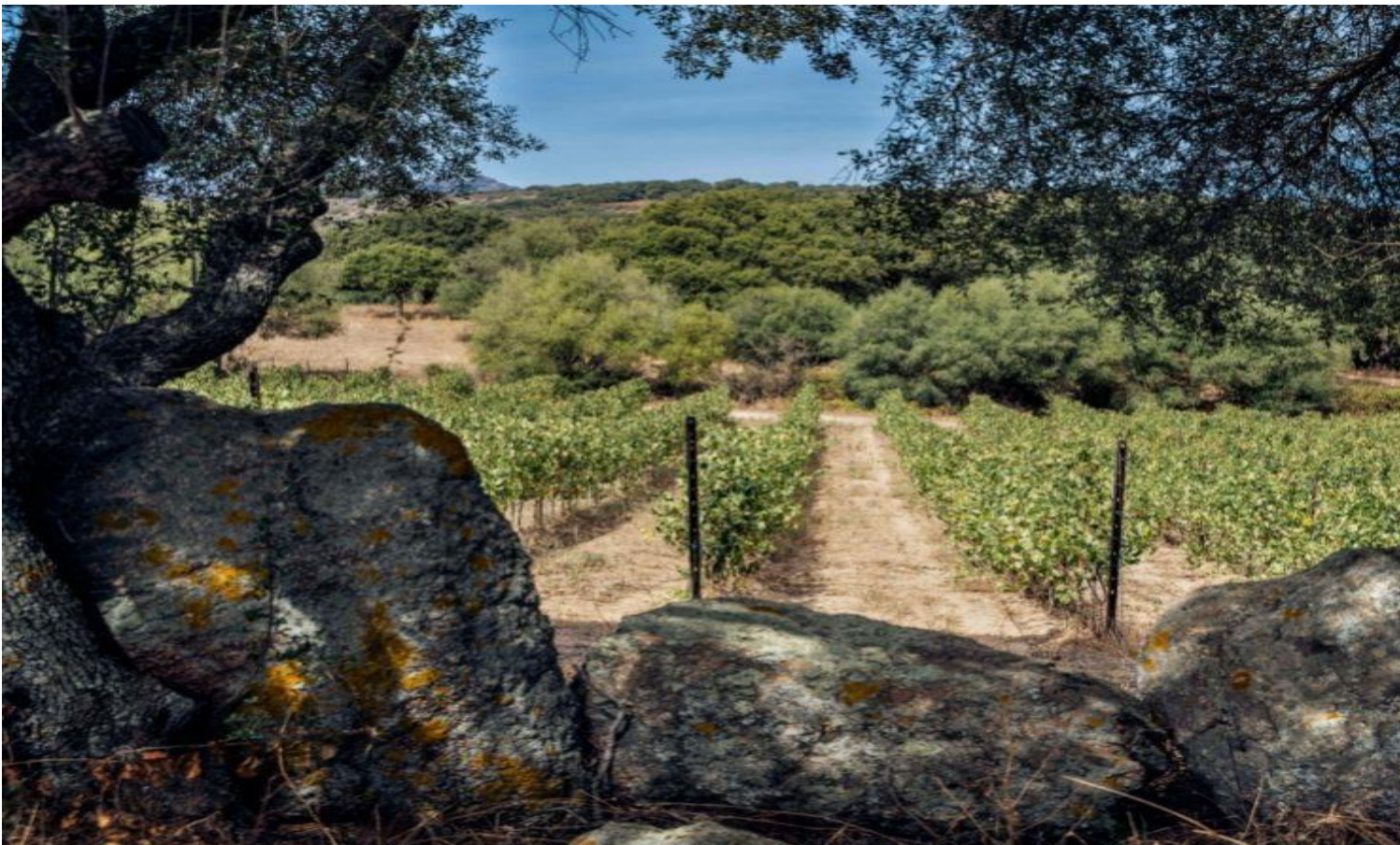
Un'immagine dei vigneti in Gallura.

«La peculiarità di questo vino, oltre al metodo, è l'utilizzo del mosto macerato sulle bucce per la rifermentazione. È questo lo strumento enologico adottato per ottenere l'obiettivo di produrre un vino fresco e leggero, moderno e cosmopolita, ma pur sempre fedele all'identità straordinaria delle nostre uve di Gallura. Solo così Nibe riesce ad esprimere pienamente i profumi varietali del Vermentino e tutta la personalità del terroir da cui proviene».