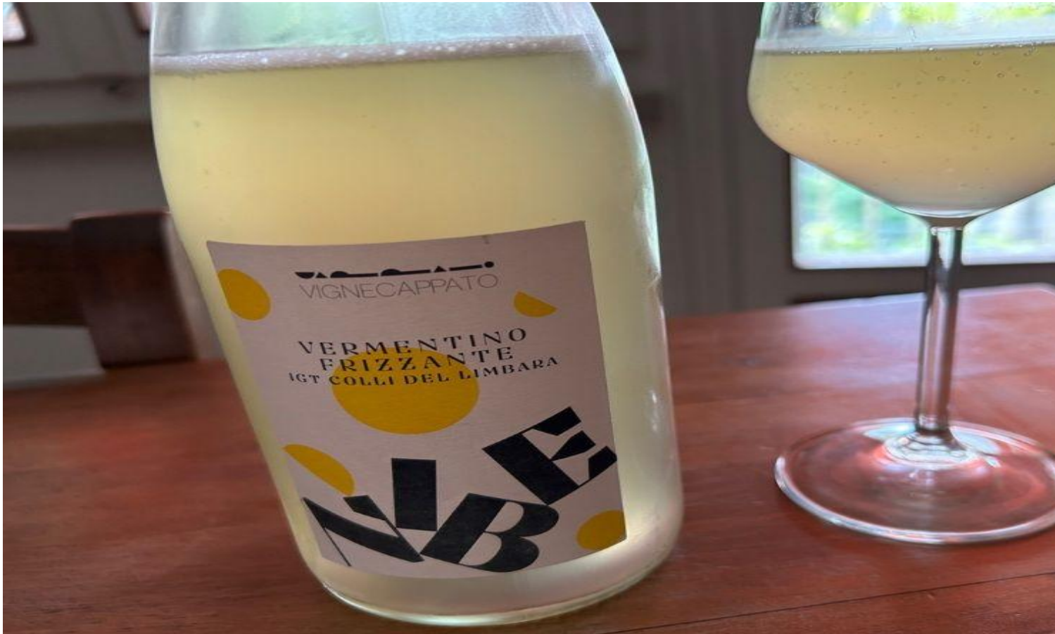
Nibe Vermentino Frizzante Igp Colli del Limbara.