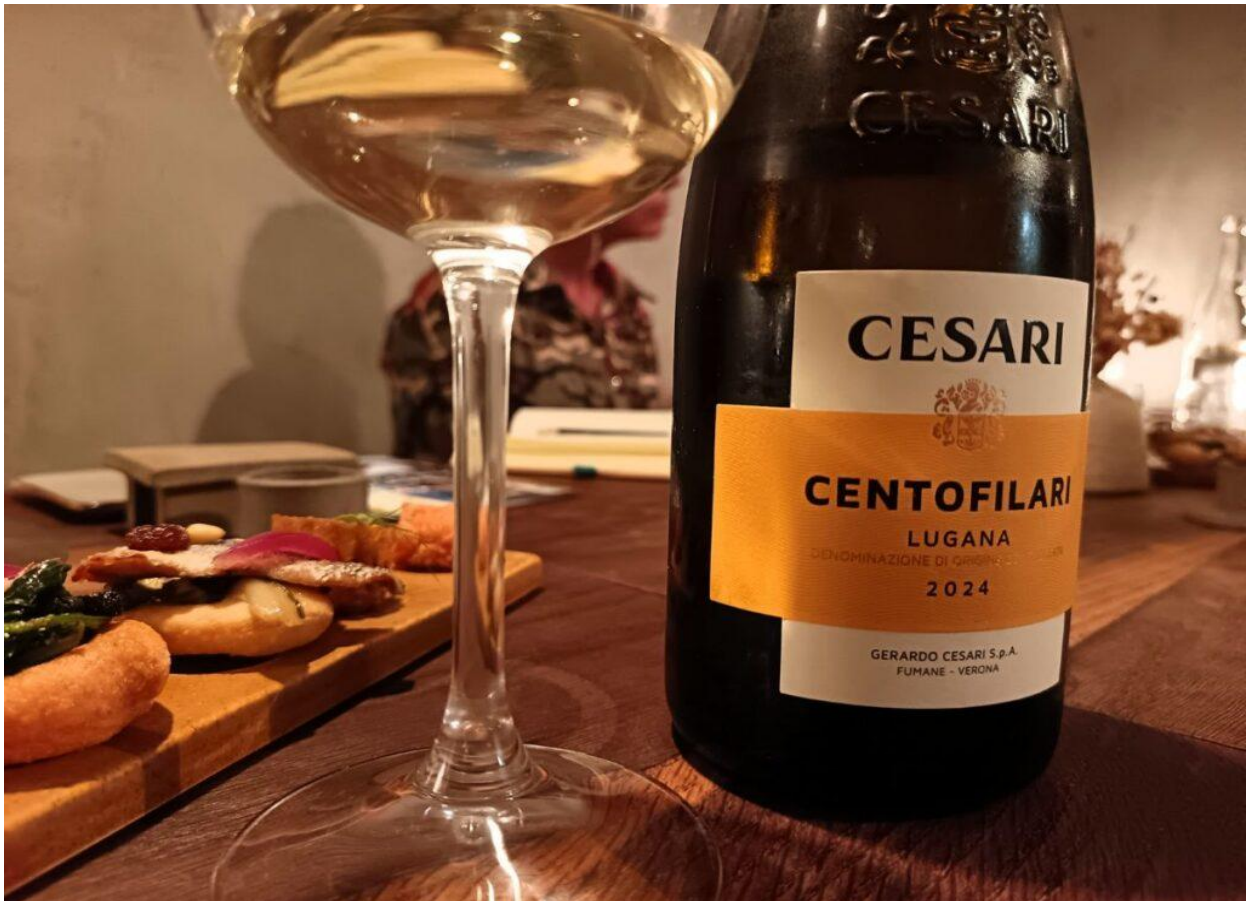
Il Lugana DOC della Linea Centofilari, blend di Turbiana e Chardonnay.

(ne avevamo già parlato qui ). Delicato, gioca al naso con aromi floreali, agrumati, mela e pesca matura si fondono con accenti di frutta tropicale. Blend in acciaio di Turbiana e Chardonnay , mineralità e acidità dialogano in bocca con la morbidezza, per un sorso armonico e pulito. L'abbinamento con il "Tonn'a Surriento" di Chef Cuciniello ha creato un ponte sensoriale tra Veneto e Campania, dove il filetto e la ventresca di tonno, arricchiti dal latte di provolone e dall'olio al basilico, hanno trovato nel Lugana Cesari un compagno ideale per esaltare la sapidità marina.