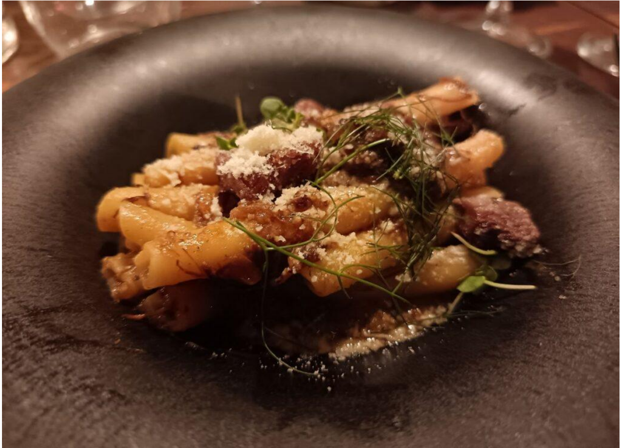
“Genovese vs Pearà” la raffinata creazione dello Chef Alberto Cuciniello.