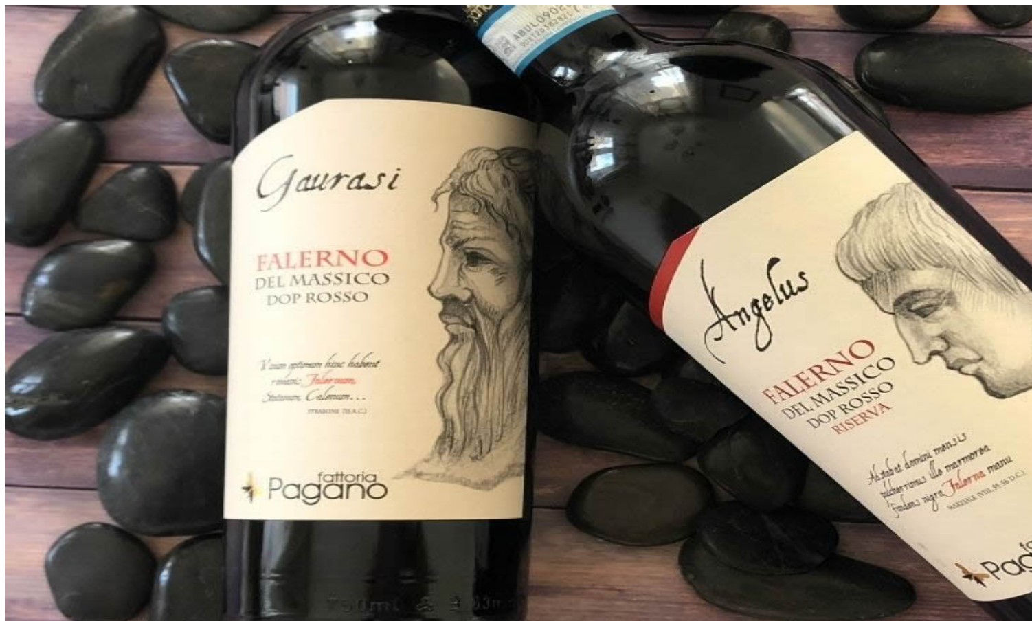
Angelus Riserva 2016 e Gaurasi 2018 (Foto © Malinda Sassu).

Intrigante e fitto, dall'elegante finezza e timbro fruttato, il Gaurasi è la versione dinamica e agile di Aglianico e 20% di Piediroso, affinati per almeno 12 mesi in acciaio. Una veste di rosso rubino luminoso e tanta frutta al naso : prugna, amarena e ciliegia, rabarbaro e note floreali di rosa appassita seguita da cacao e liquirizia. La trama tannica è finissima e il finale lungo e sapido: un Falerno in grande movimento che si contrappone alla versione Riserva nell' Angelus .