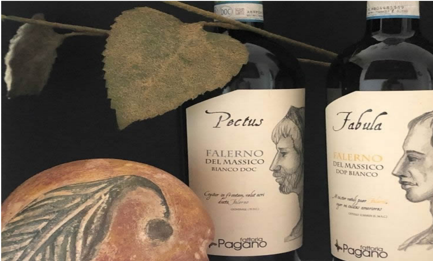
Pectus 2019 e Fabula 2020.

Due Falanghina in purezza, entrambe dal carattere deciso e di attenta espressione varietale. Quasi delle vendemmie tardive, provenienti da uve raccolte nella seconda decade di ottobre, dopo un'accurata selezione in vigna.