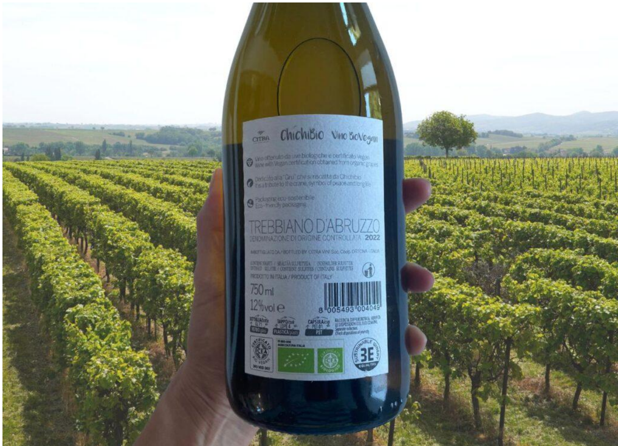
L'etichetta di un vino vegano.

Molti produttori che scelgono di seguire questa strada vanno oltre la cantina . In particolare, adottano fertilizzanti vegetali , selezionano tappi e colle cruelty-free e prestano attenzione a ogni fase della filiera, dalla vigna fino all'etichetta.