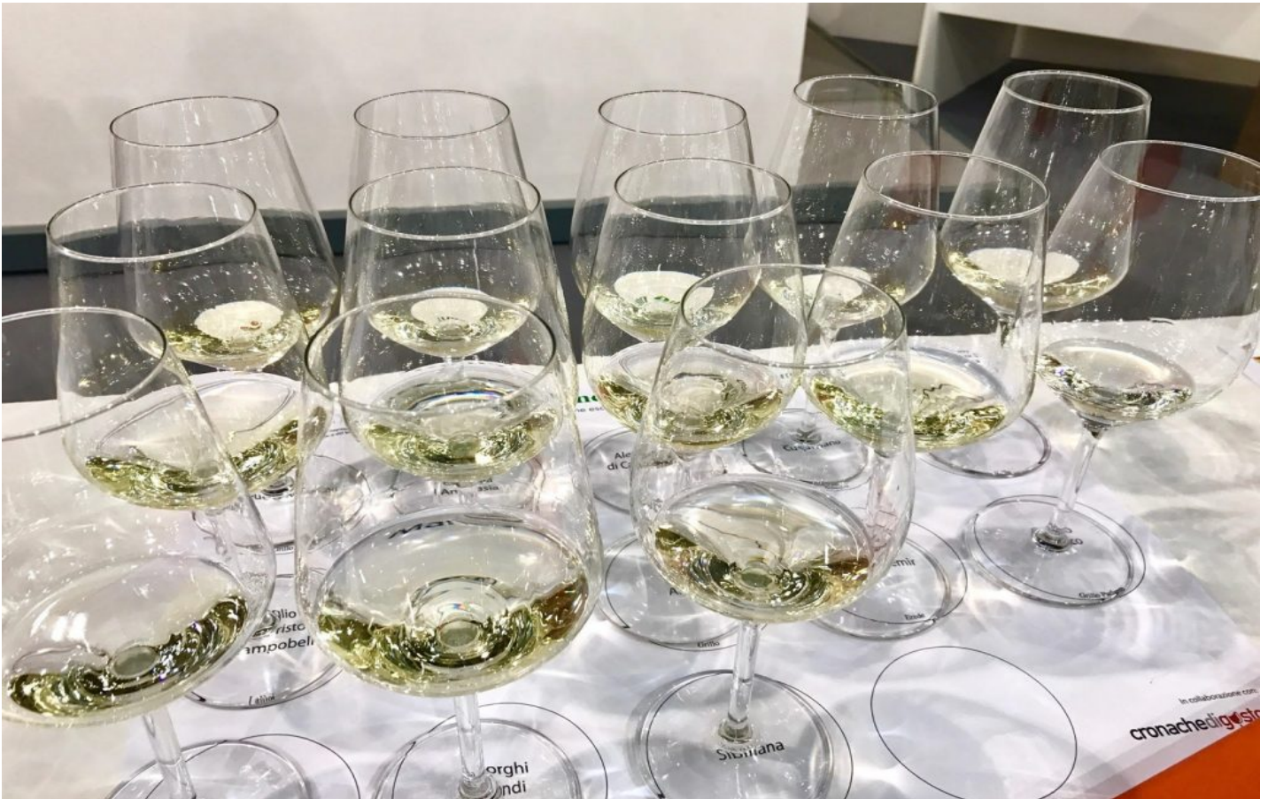
La masterclass sul Grillo, anima bianca della Sicilia.