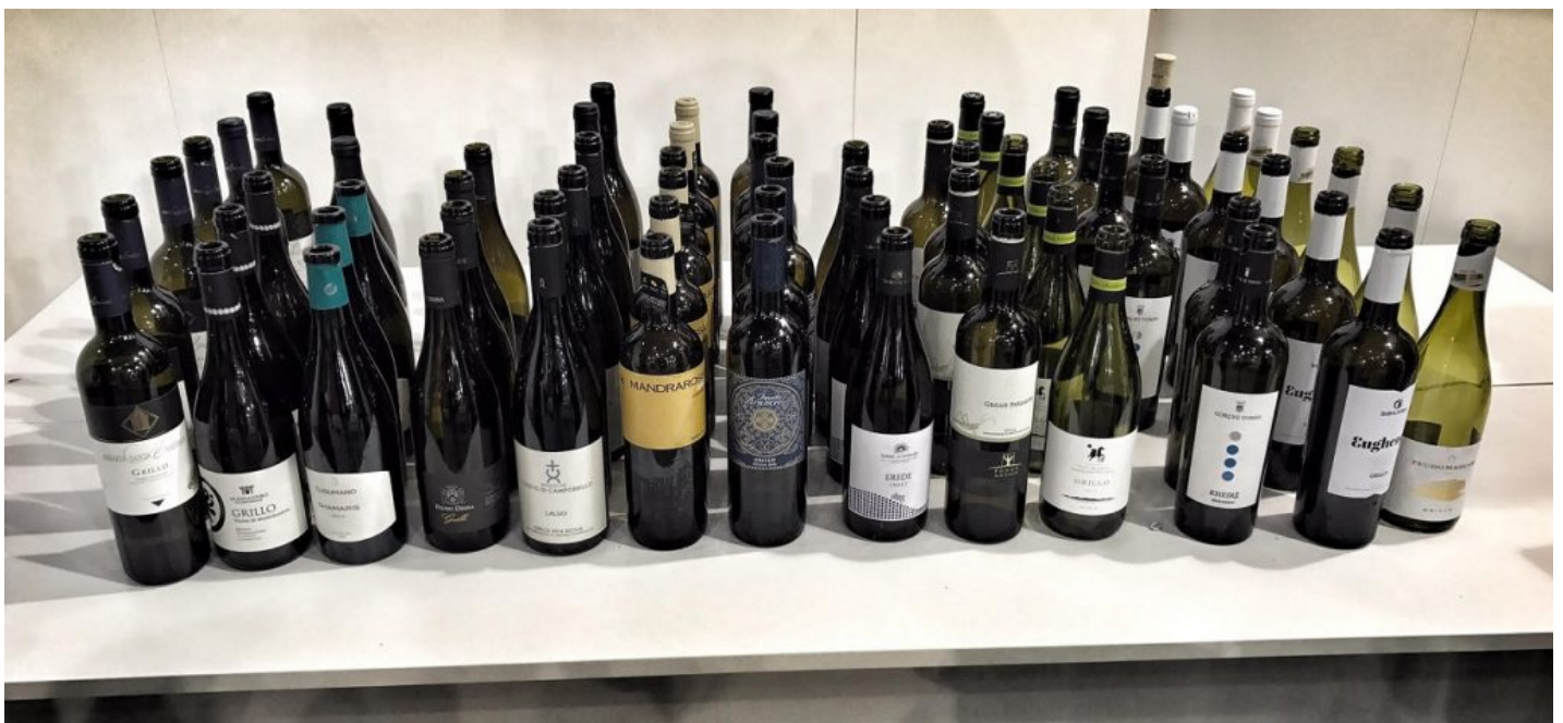
Le 13 etichette di Grillo degustate nel corso della masterclass.

Nel Marsala, il Grillo poteva vantare un lignaggio nobile rispetto agli altri, grazie anche alla sua innata eleganza e al carattere verace. La vinificazione come vitigno separato, è iniziata intorno al 2000 per valorizzare la sua adattabilità ai vari terroir, rispetto ai tanti vitigni internazionali che in Sicilia hanno successo "a macchia di leopardo".