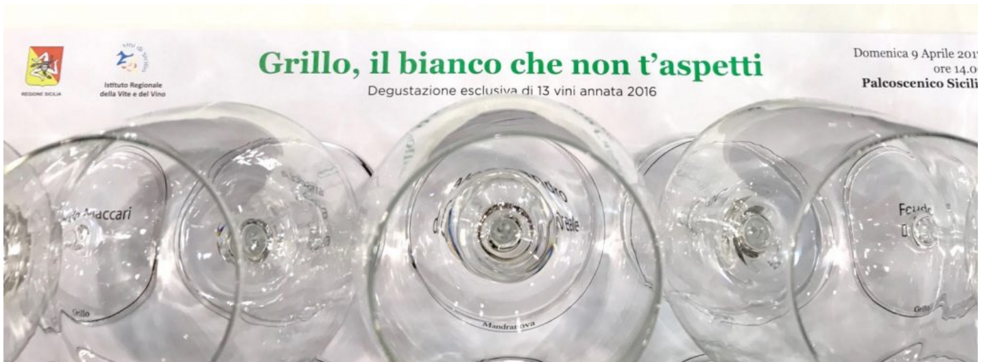
Vino Grillo Sicilia IGT: 13 etichette da provare

Conoscete il Marsala, il famoso vino liquoroso siciliano ? L'intuizione del commerciante John Woodhouse ci ha regalato questo capolavoro vinicolo, da secoli rappresentativo della Sicilia orientale . Il Marsala è creato grazie ad un uvaggio di varie uve tra cui Grillo, oltre a Catarratto e Ansonica , ognuna con una precisa personalità che contribuisce alla buona riuscita del assemblaggio.