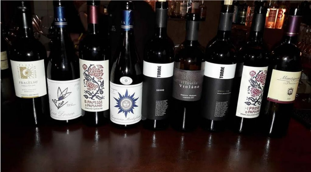
I vini della degustazione alla Baita di Faenza.

La degustazione dedicata al Romagna Sangiovese prodotto nel territorio di Modigliana, è stata realizzata alla Baita di Faenza, dove sono stati presentati otto vini . Tre ambiti specifici affrontati: