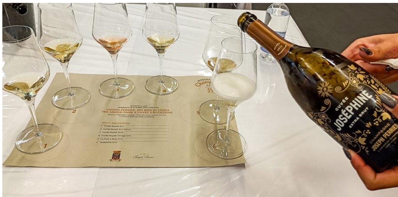
Un momento della degustazione.

Un terroir, questo di Joseph Perrier, caratterizzato da un microclima continentale, mitigato però dal fiume che ne assicura la ventilazione e da suoli prevalentemente calcarei, drenanti e molto alcalini (per cui i vini sviluppano un'acidità importante).